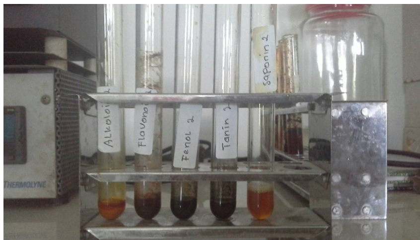
Gambar 1. Hasil Analisis Kandungan Metabolit Sekunder Daun Sirsak

Keterangan: (+) = Hasil Positif (Terdeteksi senyawa metabolit sekunder) (-) = Hasil Negatif (Tidak terdeteksi senyawa metabolit sekunder)